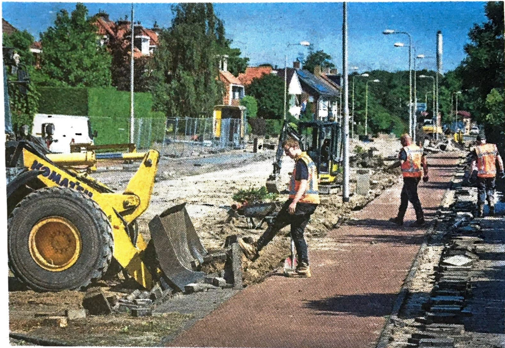
Momenteel wordt volop gewerkt aan de Van den Vondellaan.